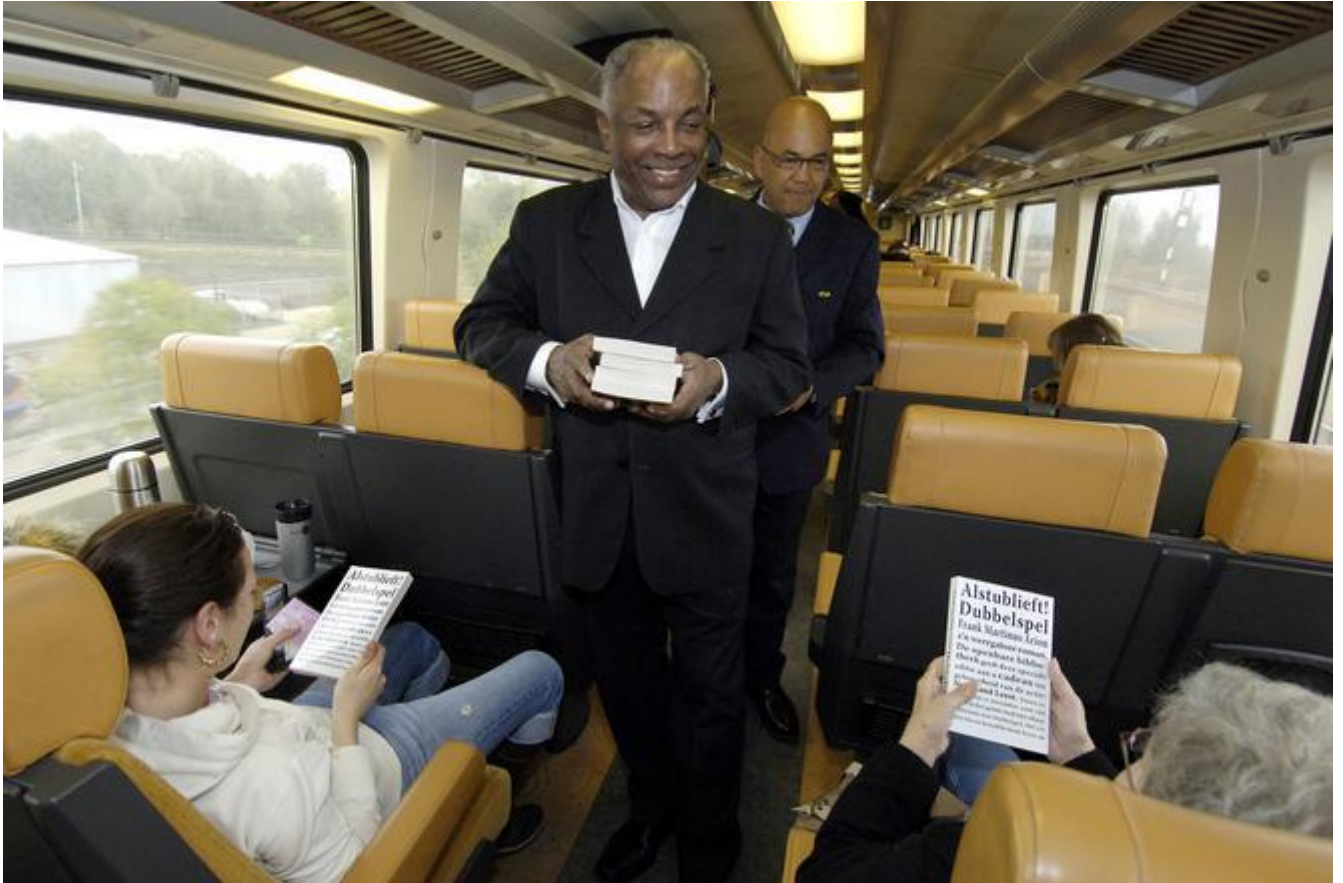
Frank Martinus Arion deelt zijn boek Dubbelspel uit aan treinreizigers.